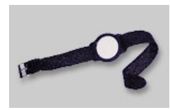
Transponder - Uhr