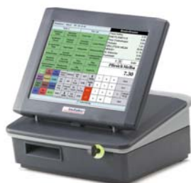
INKA Touch-Screen Serie 400