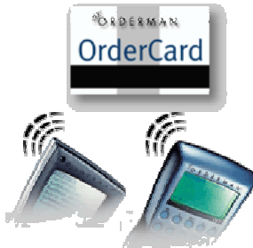
Transponder - Karte

GESTEUERT MIT KASSENSYSTEMEN VON INKA , MATRIX & IN KOMBINATION MIT HANDTERMINAL VON ORDERMAN