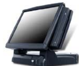
ADDIPOS Touch-Screen System ab 12"