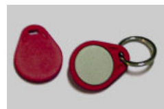
Transponder - Chip